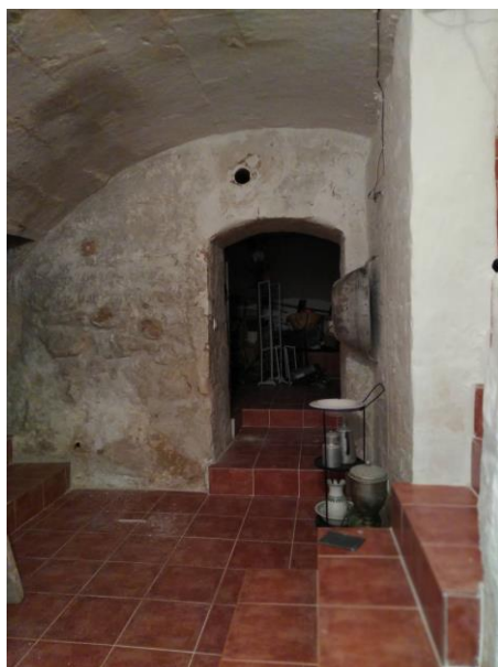
Sótano de la Calle Santa Rita 4

Con el pasar del tiempo, los datos llegaron a ser precisos: nombre y apellidos del bodeguero, año, calle y número. Al comprobar con la actualidad, bastantes casas hoy aún conservan la puerta de entrada original del sótano. (Ver fotos a continuación) Algunos sótanos son pequeños, pero hay otros que son amplios y en aquellos tiempos, dieron lugar para un local con mucho espacio para los clientes que venían a beber. Un buen ejemplo es el local en Santa Rita 4, durante un largo tiempo llevado por Pedro Caules Pons, que después de ser bodegón durante muchos años pasó a ser bar a las manos de Salvador Vives que lo mantuvo durante 40 años. El sótano aún conserva las reliquias del pasado.